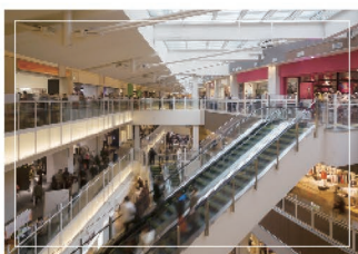
百貨店・商業施設