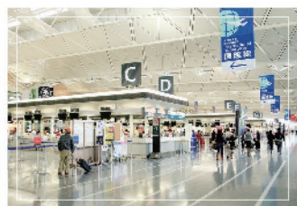
空港・駅・公共施設